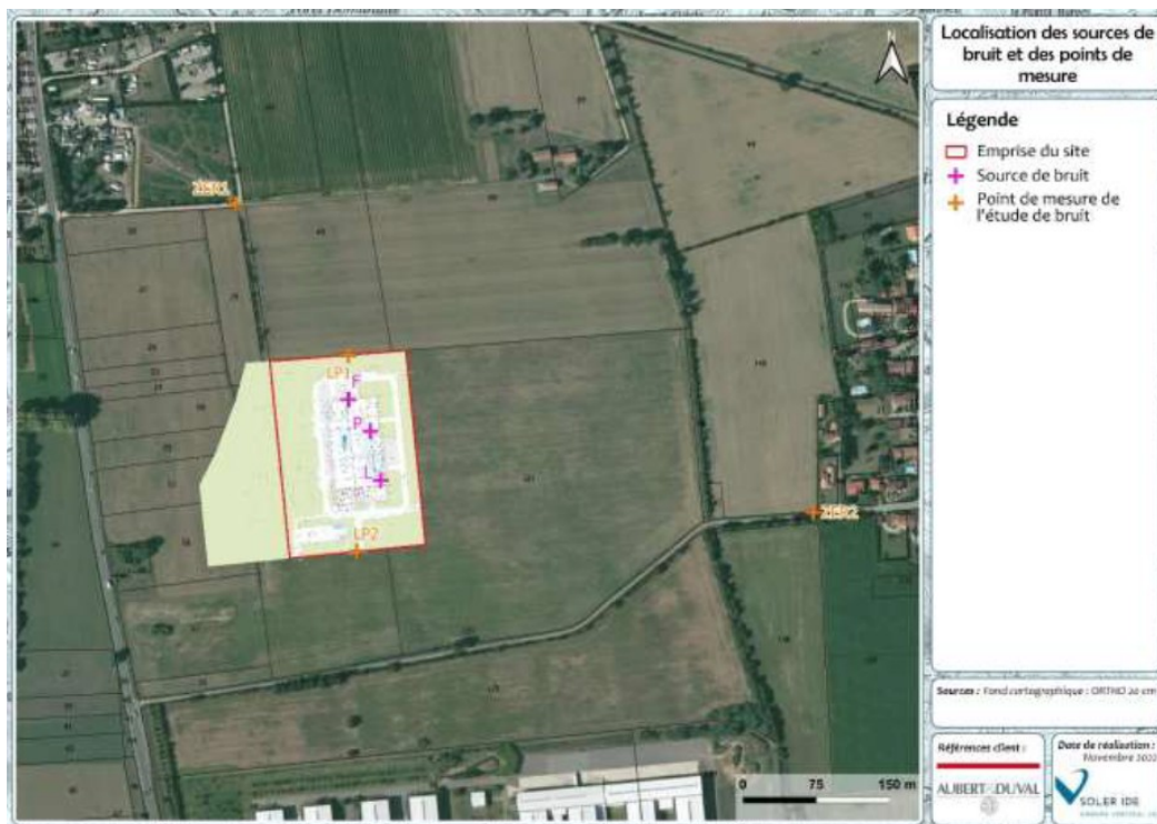
Figure 3 :Localisation des sources de bruit et des points de mesures

Ensuite, même s'il s'agissait d'émettre un avis sur la seule opération Aubert et Duval, la MRAe souligne quelques défauts majeurs. Par exemple, sur de nombreux sujets, l'aire d'étude immédiate ne correspond pas au choix d'implantation de l'opération qui était prévue initialement plus au sud, il en découle une mauvaise caractérisation des enjeux et une représentation cartographique des habitats erronée. La caractérisation de l'état initial du site d'implantation se limite à une représentation des prises de vue de terrain qui est composé de monocultures intensives. L'actualisation de l'étude d'impact de la zone d'activité aurait permis de s'affranchir de cet écueil, en se fondant sur l'état initial déjà réalisé, mais tel n'a pas été le choix du maître d'ouvrage. Dès lors, il est nécessaire ici de caractériser les impacts naturalistes dont l'analyse n'est pas argumentée ni suffisamment conclusive pour permettre à la MRAe d'évaluer la pertinence des mesures ERC (voir § préservation de la biodiversité).