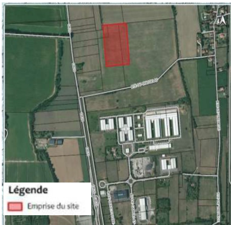
Figure 2 : Carte de localisation du projet ACS Aubert et Duval